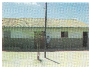
Sede - Associação/BSC