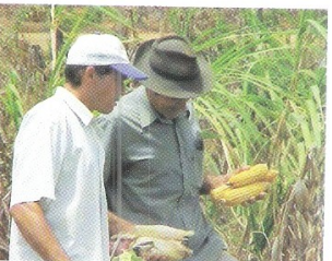
Armazenamento das Sementes